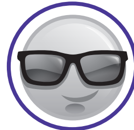
Esp. Paulina Seivach